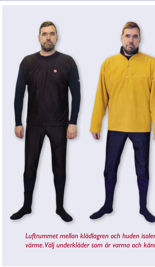
Luftrummet mellan klädlagen och huden isolerar värme. Välj underkläder som är varma och känns