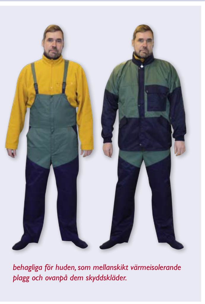
behagliga för huden, som mellanskikt värmeisolerande plagg och ovanpå dem skyddskläder.