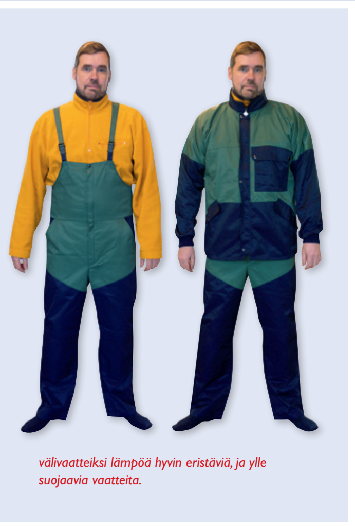
välivaatteiksi lämpöä hyvin eristäviä, ja ylle suojaavia vaatteita.