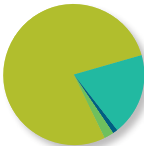
Kulut 1 107,4 milj. €